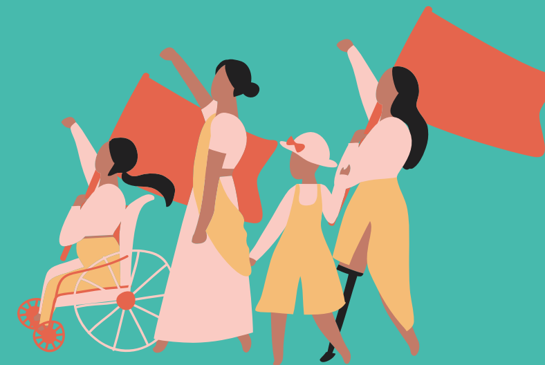
Practicalities Theory (Teori Alasan-alasan Praktis))