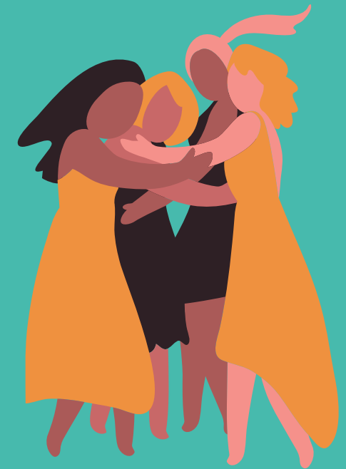
George Homans Theory (Teori George Homans)