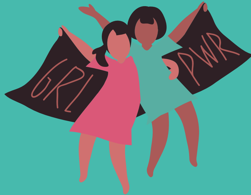
Balance Theory (Teori Keseimbangan)