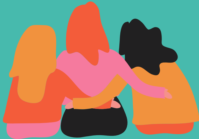
Proximity Theory (Teori Kedekatan)